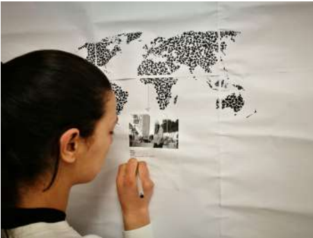
Fotografía del momento en el que el alumnado del IES Albaida (Almería) rellena el mapa del mundo con fotografías y relatos de otras partes del mundo.

La salud es un derecho mundial y debemos de conocer lo que sucede en otras partes del mundo.