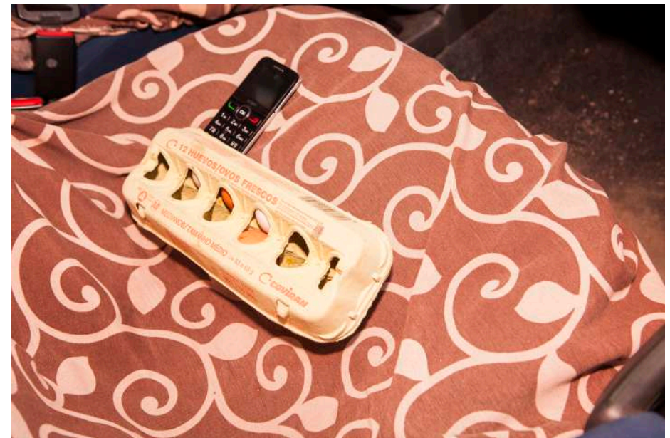
Fotografía realizada por el alumnado del IES Alto Almanzora (Tijola) en uno de sus itinerarios para realizar un diagnóstico del pueblo.

- Primer plano: recoge una parte pequeña de la figura humana o de un objeto. Sus usos son expresivos, simbólicos y dramáticos.