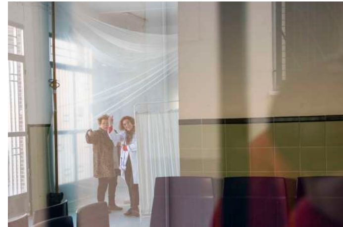
Fotografía realizada por el alumnado del IES Alto Almanzora (Tíjola) a especialista de la salud y paciente basándose en la regla de los tercios

Consiste en dividir mediante líneas imaginarias el encuadre en tres partes horizontales y verticales. Los puntos de unión entre esas líneas son los puntos fuertes. En total son