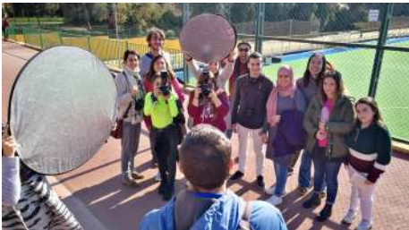
Fotografía realizada en el momento de la toma de un retrato de un vecino del barrio de Carranque (Málaga) por parte del alumnado del C.D.P. Santa María de los Ángeles.

¿Cuánto cuesta crear un medicamento? ¿Cuál es el coste para el vecindario de tu barrio? ¿Y cómo es la situación de las personas mayores en relación al acceso a medicamentos y el derecho a la salud? ¿cómo viven el hecho de no poder hacer frente al precio del copago de los medicamentos? ¿Y qué pasa con las personas en situación más desfavorecida?