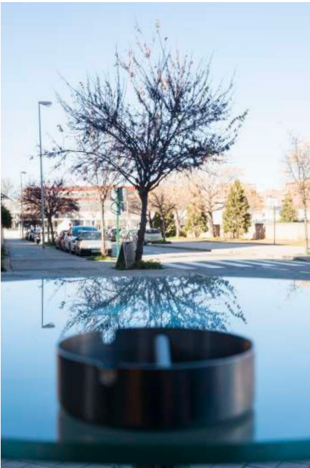
Fotografía realizada por el alumnado del IES Madraza (Granada) en uno de sus itinerarios para realizar un diagnóstico del barrio del Almanjajar.

¿Conoces el barrio con un enfoque centrado en la salud? ¿Cómo está planteado tu barrio en relación a la salud? ¿Qué accesibilidad existe? ¿Cómo está la salud presente en nuestro entorno?