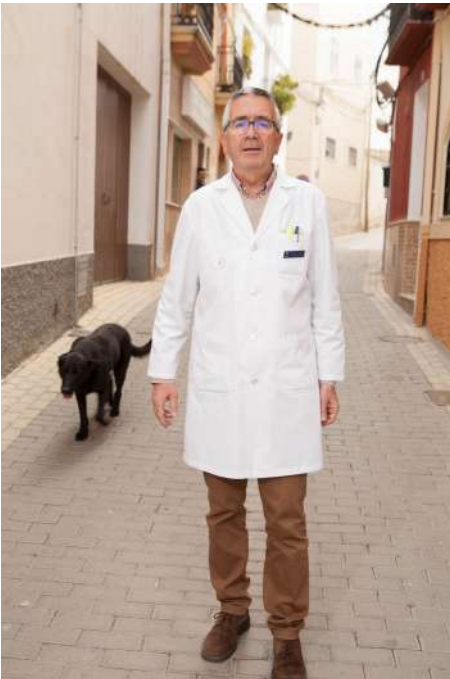
Farmacéutico comunitario entrevistado y fotografiado por el alumnado del IES Alto Almanzora (Tíjola).