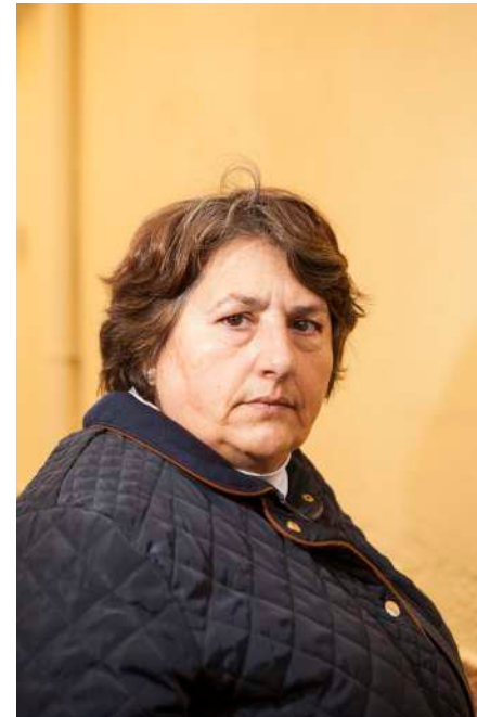
Díptico creado por el alumnado del IES Alto Almanzora (Tijola, Almería).

La capacidad narrativa de la fotografía se amplía cuando jugamos con dos imágenes. Al juntarlas estamos relacionándolas, las estamos haciendo una dependiente de la otra.