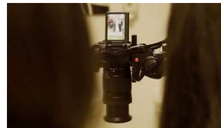
Fotografía realizada durante la preparación del equipo fotográfico para la realización de fotografías de los archivos familiares del alumnado del C.D.P. Santa María de los Ángeles (Málaga).