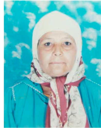
Fotografía de archivo de familiar de alumna del IES Albaida (Almería) que emigró a España.

No podemos abandonar las señales que nos enseña la fotografía. Tenemos que buscar e indagar a modo de detective todos los mensajes que nos envía la fotografía. De esta manera evitaremos una lectura superficial y se profundizará en la intención estética y narrativa del fotógrafo y su significado.