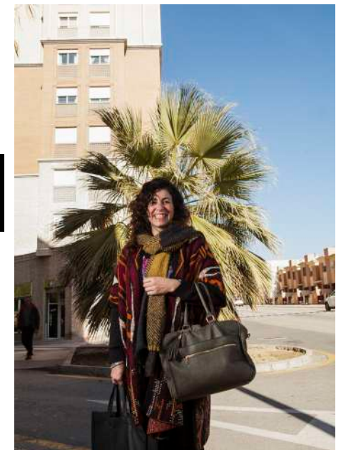
Representante farmacéutica entrevistada y fotografiada por el alumnado del IES La Madraza (Granada).