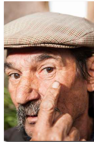
Publicación realizada por el alumnado participante en las sesiones del proyecto Revelando Salud.

- Rotuladores de colores, tijeras, pegamento, revistas, periódicos y fotografías de archivo.