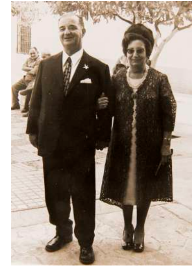
Fotografía de archivo de familiares de alumna del C.D.P. Santa María de los Ángeles (Málaga) que emigraron a Marruecos.