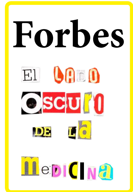
Collage informativo y de denuncia sobre las malas prácticas de algunos laboratorios farmacéuticos haciendo uso de la estética de la revista Forbes.

y Farmamundi Fotolibro Revelando Salud , apartado Intervenciones de urgencia