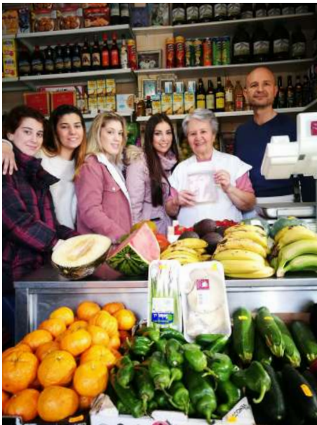
Fotografía realizada en el momento de la entrega de la publicación Revelando Salud al vecindario del barrio del Carranque y el alumnado del C.D.P. Santa María de los Ángeles (Málaga) participantes en el proyecto.

Existe entre el vecindario un gran desconocimiento en torno a las problemáticas de otras personas en el ámbito de la salud. Con el fanzine autoeditado colectivamente podremos dar a conocer situaciones poco conocidas, sensibilizar e impulsar procesos de cambio social.