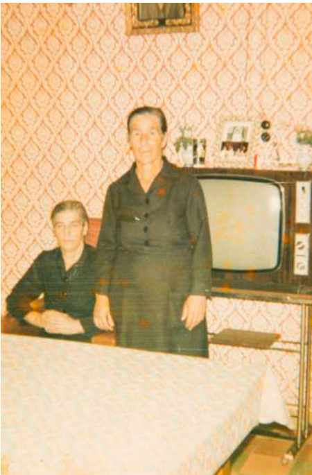
Fotografía relizada en 1974 perteneciente al archivo familiar de una alumna del IES Madraza (Granada).

El archivo familiar está compuesto de historias de vida que están esperando ser descubiertas. Es la memoria de nuestra familia, que es necesario conocer para afrontar el presente y construir el futuro.