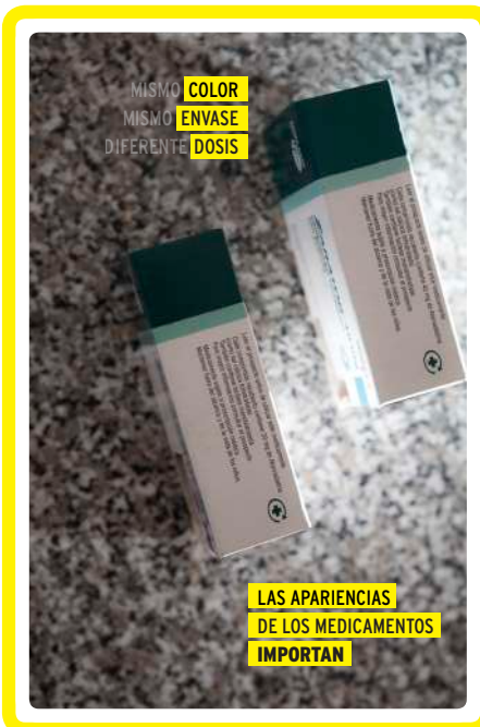
Tarjetón informativo y de consejos sobre los diseños similares de diferentes medicamentos.

Después de conocer las problemáticas que existen en relación al acceso a medicamentos y el derecho a la salud debemos de ofrecer mayor información (y soluciones) al vecindario del barrio con el objetivo de sensibilizar ante realidades cercanas y no tan cercanas.