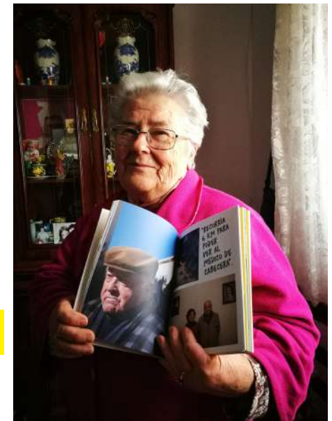
Fotografía realizada durante la entrega de la publicación Revelando Salud a una vecina de Tíjola (Almería) participante en el proyecto.

Silvia Font Cómo hacer un fanzine La Ampliadora | Escuela Social de Fotografía Documental Revelando Salud