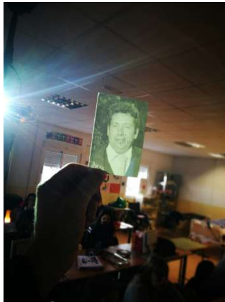
Fotografía realizada en el momento de las presentaciones del archivo fotográfico familiar por parte del alumnado del IES Alto Almanzora (Tíjola).

El blanco y negro habla del paso del tiempo, del pasado, de lo que fue, del recuerdo. Tiene el valor de dramatizar y aumentar la presencia de la fotografía.